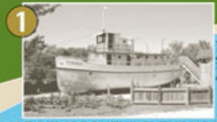
1 LE REMORQUEUR PYTHONGA