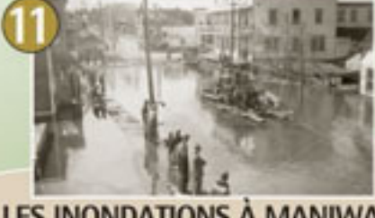
11 LES INONDATIONS À MANIWAKI