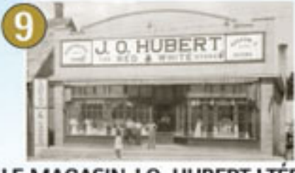
9 LE MAGASIN J.O. HUBERT LTÉE – 1925

Carte postale, The Hollinger Co., Ltd. Canada