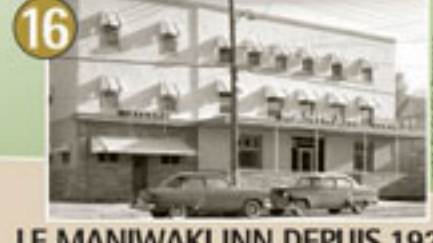
16 LE MANIWAKI INN DEPUIS 1929 (2 thèmes)