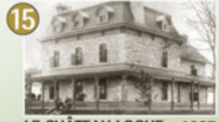
15 LE CHÂTEAU LOGUE – 1887

Photo de Maniwaki, Paul Girard, Septembre 1948, BARRÉ, Centre d'archives de Maniwaki, Office de l'île de Québec, EL57,551,1021118