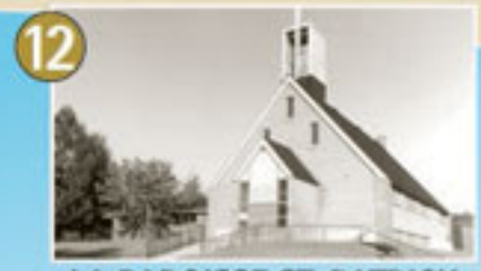
12 LA PAROISSE ST-PATRICK