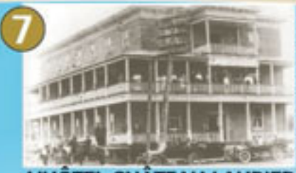
7 L'HÔTEL CHÂTEAU LAURIER

1 er hôtel de ville de Maniwaki BARRÉ, n° 988, 1037551, 10021118 Comité Socio-culturel de Maniwaki