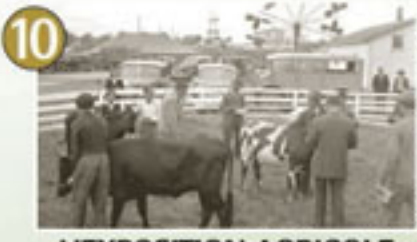
10 L'EXPOSITION AGRICOLE DU COMTÉ DE GATINEAU

Photo de Maniwaki, Paul Girard, Septembre 1948, BARRÉ, Centre d'archives de Maniwaki, Office de l'île de Québec, EL57,551,1021118