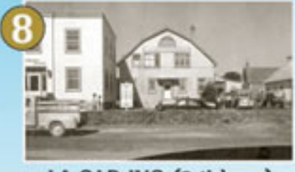
8 LA C.I.P. INC. (3 thèmes)

Congrégation, Maniwaki, J. Desjardins, Avril 1941, BARRÉ, Centre d'archives de Maniwaki, Office de l'île de Québec, EL57,551,1021118