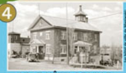
4 LE 1 ER HÔTEL DE VILLE DE MANIWAKI – 1931

1 er hôtel de ville de Maniwaki BARRÉ, n° 988, 1037551, 10021118 Comité Socio-culturel de Maniwaki