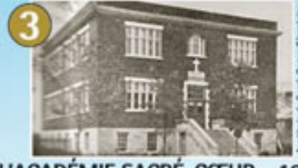
3 L'ACADÉMIE SACRÉ-CŒUR – 1935

Académie de Sacré-Cœur, Maniwaki, Avril 1941, BARRÉ, Centre d'archives de Maniwaki, Office de l'île de Québec, EL57,551,1021118