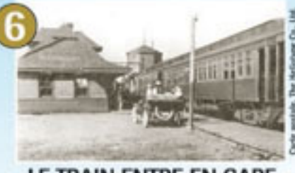
6 LE TRAIN ENTRE EN GARE À MANIWAKI – 1904 (2 thèmes)

Académie de Sacré-Cœur, Maniwaki, Avril 1941, BARRÉ, Centre d'archives de Maniwaki, Office de l'île de Québec, EL57,551,1021118