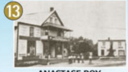
13 ANASTASE ROY, UN HOMME D'AFFAIRES PROSPÈRE